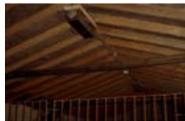
Stand alone monterad