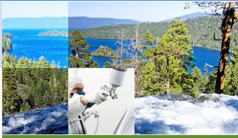
Dust Particle Decay